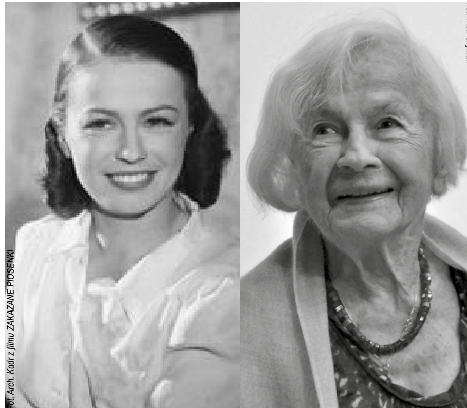
Kadr z filmu ZAKAZANE PIOSENKI